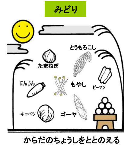
からだのちょうしをととのえる