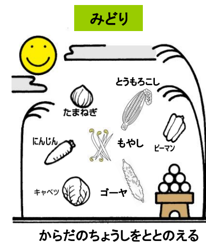
からだのちょうしをととのえる