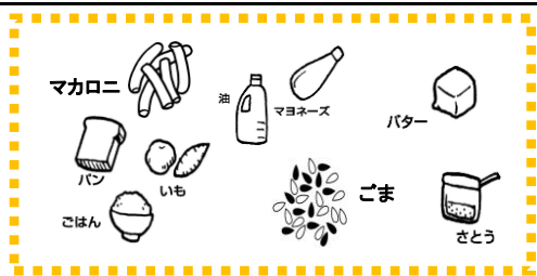
きいろ ねつやエネルギーのもとになる

栄養三色 各材料が栄養三色では何色になるかをのせています。ひとりあ 1人当たりの使用量(g) 中学年の栄養量 (3・4年生)