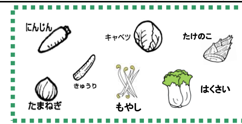
みどり からだのちようしをととのえる

えいようさんしょく 食べ物のほたらきによって栄養三色 3つのなかまに分けられます