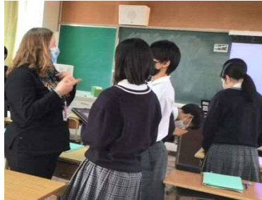
中学校外国語科のやりとりを中心とした授業