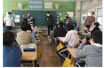
5人のALTとコミュニケーションする英語村