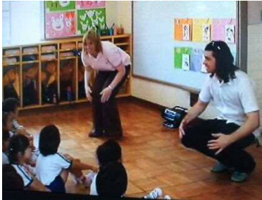
幼稚園・こども園での遊びを通じた国際理解

東大阪市では、全学校園に「ALT（外国語指導講師）」や「AET（英語指導助手）」を配置し、英語教育を推進しています。英語のネイティブスピーカーと接したり、暗唱大会・英語まつり・英語村等に参加したりするなど、英語を使って伝え合う活動を通して、異なる文化への理解、コミュニケーション能力の育成を図っています