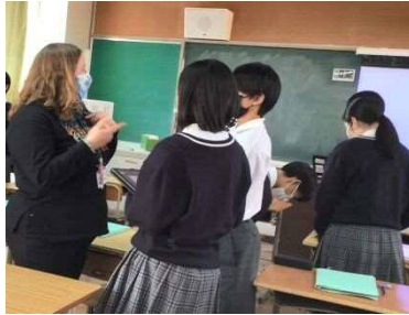
中学校外国語科のやりとりを中心とした授業