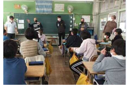
5人のALTとコミュニケーションする英語村