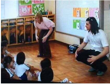
幼稚園・こども園での遊びを通じた国際理解

ぜんがっこうえん えーえるていー がいこくごしどうこうし えーいーていー えいごしどうじょしゅ はいち えいごきょういく 全学校園に「ALT (外国語指導講師)」や「AET (英語指導助手)」を配置し、英語教育 を推進しています。英語のネイティブスピーカーと接したり、英語まつり・英語村等に参加し たりするなど、英語を使って伝え合う活動を通して、異なる文化への理解、 コミュニケーション能力の育成を図っています