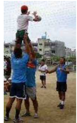
迫力満点のリフト体験☆

6月28日(木)に、大阪府府民文化部文化・スポーツ室スポーツ振興課主催による平成30年度「トップアスリート小学校ふれあい事業」(ラグビー教室)が池島小学校にて開催されました。講師として近鉄ライナーズの4選手を迎える中で、最初は選手を持ち上げる「リフト」のデモンストレーションから