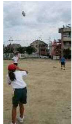
キック&キャッチ練習♪

来年度、「2019年ラグビーワールドカップ」を控え、ラグビー熱が高まっている東大阪市ですが、今日、貴重なラグビー体験をした子どもたちの中から、新たに世界をめざす選手が生まれたらいいですね。常に子どもたちの笑顔が絶えない、とても素敵なふれあい事業でした。