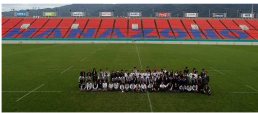
東大阪市立中学校生徒会

子どもたちや保護者のSOSをいちはやくキャッチするための3桁の番号です。お近くの児童相談所へつながります。