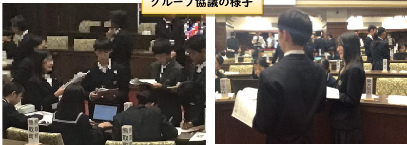
グループ協議の様子

参加した生徒は、他校が発表した取組みに興味津々で、たくさんの質問をしていました。