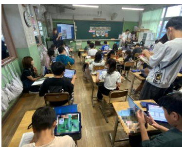
ICT×図書館資料を活用した授業風景 (若江小)