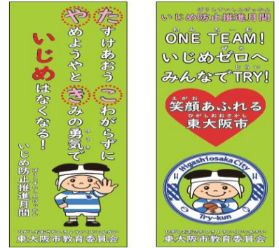
7月いじめ防止推進月間啓発のぼり

保護者や地域の方におかれましても、子どもたちに気になる様子がありましたら、学校園または学校教育推進室までお知らせいただき、解決に向けて一緒に考え、取り組んでいきましょう。