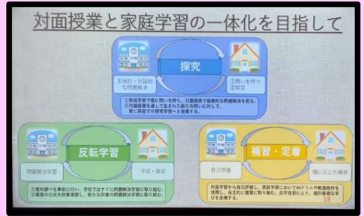
オンデマンド配信画面

今後は、学力向上フラッグシップ校を中心としたグループごとに、取り組み状況等について交流を深め、そこで学んだことを自校で普及・発信し、自校の取り組みを深化させていきます。