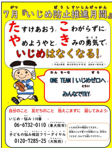
7月いじめ防止推進月間啓発ポスター

東大阪市では、「東大阪市いじめの防止に関する条例」において、7月を「いじめ防止推進月間」と定め、いじめの防止について広く啓発しています。いじめ防止対策推進法では、いじめの定義は以下の通り示されています。