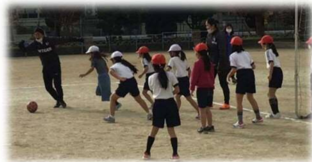
コーチ対児童のゲームが盛り上がりました!

本事業は東大阪市立小学校にセレッソ大阪の選手・コーチを派遣し、直接的なふれあいを通じて、スポーツの素晴らしさや感動を共有するもので、子どもたちに、夢や希望を与え、運動・スポーツに親しむ態度や習慣を身に付けることを目的とし実施しています。また今年度は、希望する学校で、セレッソ大阪スポーツクラブの管理栄養士による食育指導も行われ、「望ましい食生活について」授業をしていただきました。仲間と協力して活動する中で、スポーツの素晴らしさにふれることができたり、食の大切さについて学んだりすることができました。