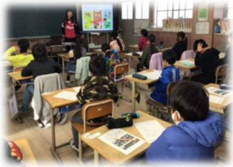
栄養素の役割について学びました

本事業は東大阪市立小学校にセレッソ大阪の選手・コーチを派遣し、直接的なふれあいを通じて、スポーツの素晴らしさや感動を共有するもので、子どもたちに、夢や希望を与え、運動・スポーツに親しむ態度や習慣を身に付けることを目的とし実施しています。また今年度は、希望する学校で、セレッソ大阪スポーツクラブの管理栄養士による食育指導も行われ、「望ましい食生活について」授業をしていただきました。仲間と協力して活動する中で、スポーツの素晴らしさにふれることができたり、食の大切さについて学んだりすることができました。