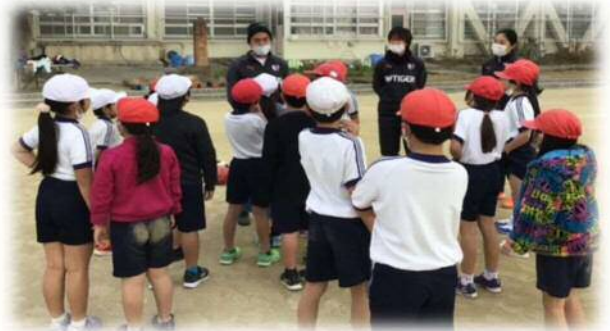
コーチ・選手の話に興味津々