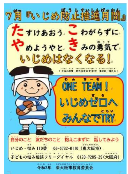
7月いじめ防止推進月間啓発ポスター

保護者や地域の方におかれましても、子どもたちに気になる様子がありましたら、学校園または学校教育推進室までお知らせいただき、解決に向けて一緒に取り組んでいきましょう。