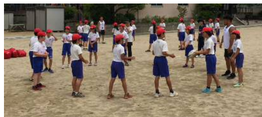
円陣を組んでパス♪

2019年へ向けて、ラグビー熱が高まっていますが、新たなラグビー選手が生まれる瞬間を見られたような、そんな素敵なふれあい事業でした。