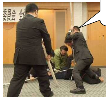
枚岡・河内・布施警察署による不審者対応訓練の様子