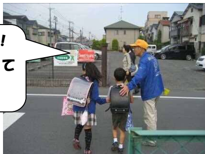
愛ガード協力員による見守り活動

また本市では「地域の子どもは地域で守る!」を合言葉に、愛ガード運動協力員の活動に支えられ、子どもたちが安心して元気に学校園生活を送っています。これからも学校園・家庭・地域が連携し、子どもたちの安全確保に努めていきます。