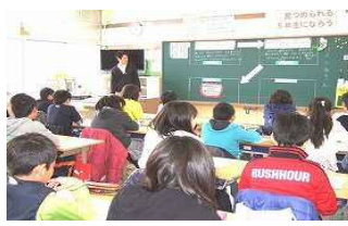
【道徳公開授業の様子】