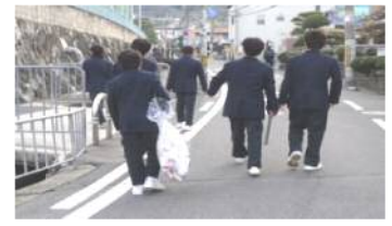
【校区美化奉仕活動の様子】