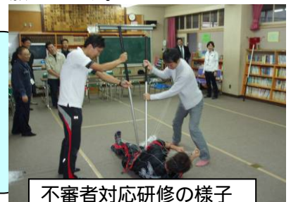
不審者対応研修の様子