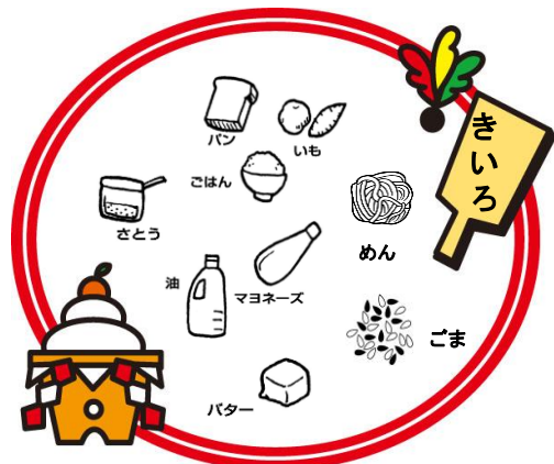
ねつやエネルギーのもとになる

えいようさんしよく 栄養三色 食べ物にはたらきによって3つのなかに分けられます。