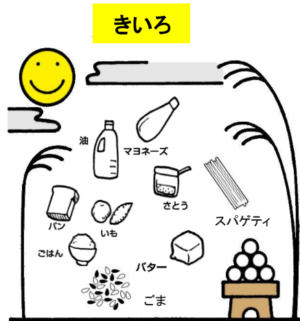
ねつやエネルギーのもとになる