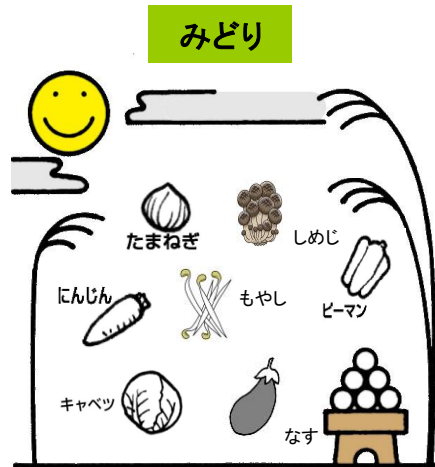
からだのちょうしをととのえる