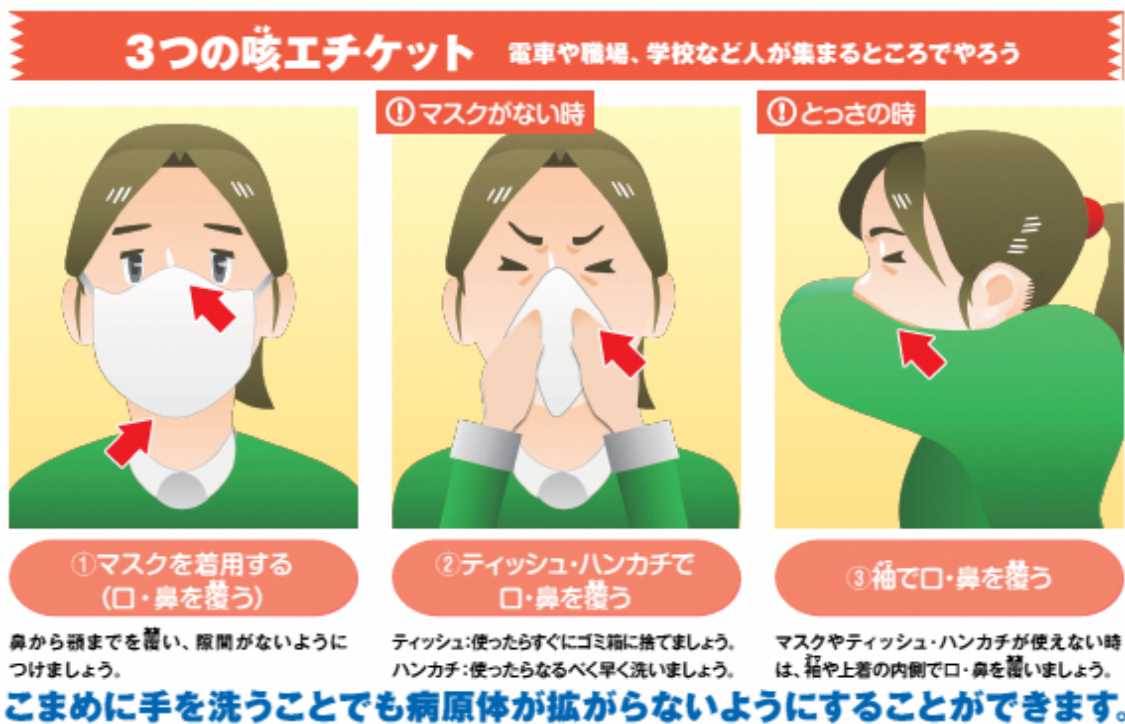
図3 咳エチケットについて