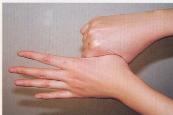
5. 親指と手掌をねじり洗いする