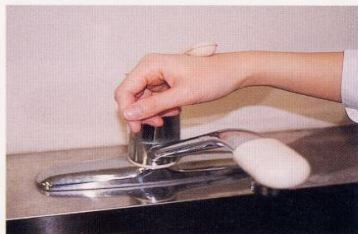
7. 水道の栓を止めるときは、手首か肘で止める。できないときは、ペーパータオルを使用して止める