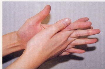
4. 指の間を十分に洗う