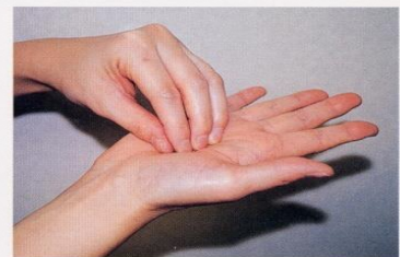
3. 指先、爪の間をよく洗う