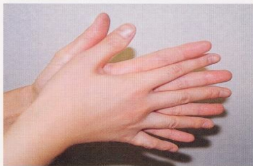
1. 手のひらを合わせ、よく洗う