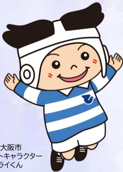
東大阪市 マスコットキャラクター トライくん

あーる すいしん ちきゅうかんきょうほぜん 3Rの推進・地球環境保全や かんきょうびか すいしん 環境美化の推進についての ぼしゅう ポスターを募集するでえ～！