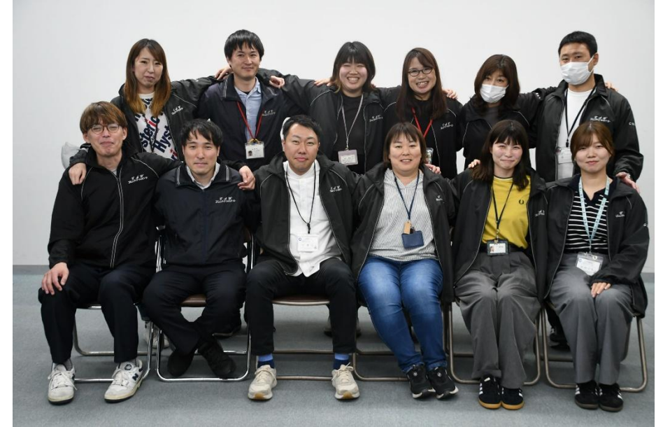
いきいきネット相談支援センターの CSWのみなさま

今回お話を伺ったのは、あるCSWと、その関わりを通して少しずつ地域とのつながりをもてるようになった若者です。外へ出ること苦手意識があり、人が多い場所を避ける傾向にありましたが、現在は、月に1度自治会館で開かれるコミュニティサロンに参加し、飲み物やお菓子の配膳、片付けなどを手伝っています。以前はCSWの付き添いが必要でしたが、今では1人で会場に来られるようになり、参加も2年ほど続いています。本人にとっても「楽しい」と感じられる時間になっているそうです。サロンには高齢の参加者が多く、「同世代よりも年上の方と一緒にのほうが気楽に過ごせる」と話し、「家から出られるようになった」と振り返ります。また、CSWについては「お姉ちゃんのように話しやすい存在」と語ってくれました。普段は、配信活動や音楽、ダンスなど、自分の「好き」を大切にしています。こうした興味や関心が、人との関わりをさらに広げるきっかけにもなっています。日々の生活の中で安心して関われる場所や人とのつながりが、孤立を防ぎ、自分らしく暮らしていく支えとなっていることが伝わるエピソードでした。