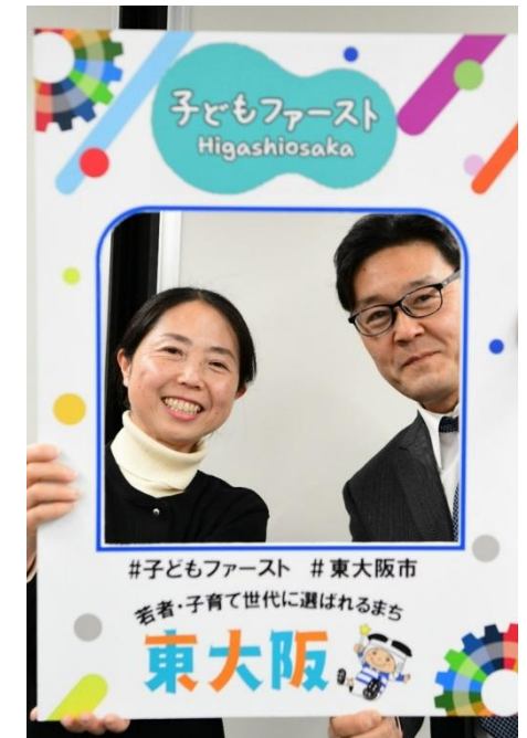
東大阪市子どもの権利に関する条例制定審議会の公募市民委員のみなさま