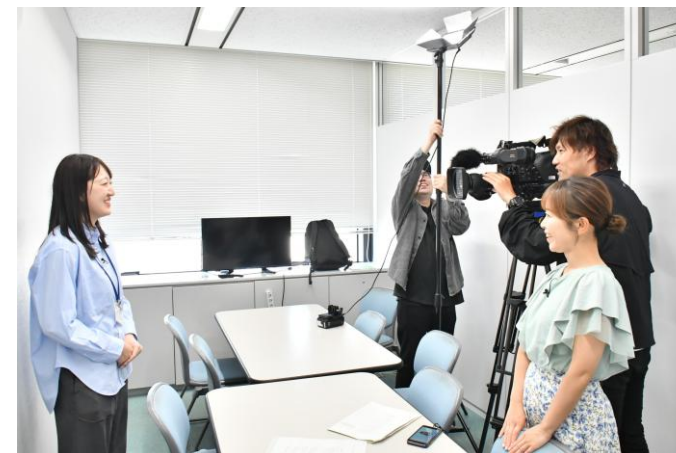
広報番組の撮影の様子

特に本市の広報番組「虹色ねっとわーく」では、日替わりのニュースや15分の企画コーナーなどを通して、市民の皆さんにぜひ知っていただきたい情報を、より分かりやすくお伝えできるよう、企画・制作に取り組んでいます。