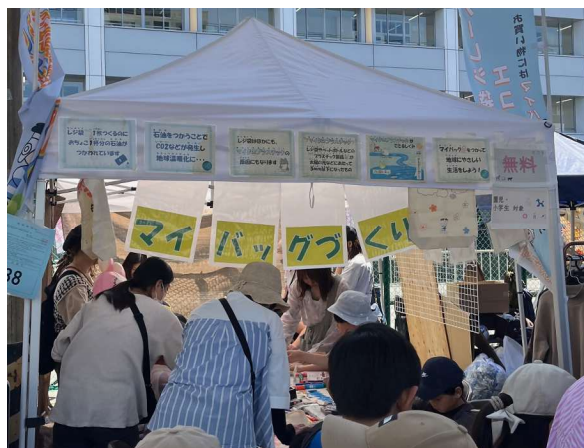
5月・「ふれあい祭り」