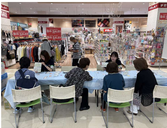
6月・「食育フェスタ」