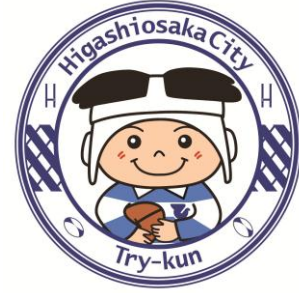
東大阪市マスコットキャラクター 「トライくん」