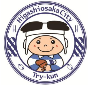
東大阪市マスコットキャラクター 「トライくん」

令和8年5月13日(水)9時から 令和8年6月10日(水)17時30分まで 期間中24時間申込可能