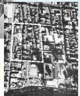
ヴェル・ノール布施建設前の地区状況

布施駅北口第一地区市街地再開発事業は、21世紀を視野に入れたまちづくりのリーディングプロジェクトとしてスタートし、約20年の歳月をかけて平成8年3月に完成