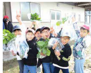
令和7年度交付事業(抜粋)

募集期間 4月上旬～5月中旬 応募件数 7件程度 選考方法 書類審査、プレゼンテーション 補助金額 1団体につき30万円以内 ※本事業の実施は、令和8年度予算案が市議会で議決され、成立することを条件としています。申請方法など、詳しくは決まり次第、市ウェブサイトなどでお知らせします。