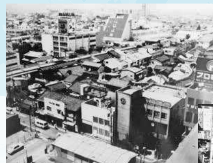
再開発前の布施駅北口地区の状況

図3月1日(日)10時～17時 図布施駅北口駅前交通広場 図マルシェ、ワークショップ、キッチンカーなど(予定)