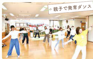
親子で発育ダンス