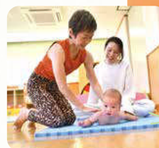
ベビーピクス&amp;ママヨガ