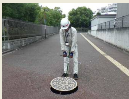
～マンホールの蓋開け～

◆窓口業務 タッチパネルによる下水道台帳図の公開と説明、下水道に関する申請手続き等を行っています。