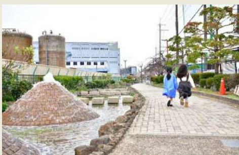
～鴻池四季彩々とおり～