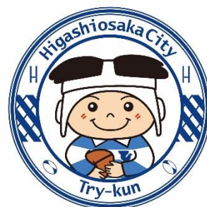
東大阪市マスコットキャラクター 「トライくん」