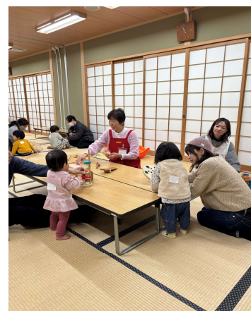
おもちゃの広場の様子。親子で一緒にグッドトイを使ってあそびましょう。

今年も年4回のおもちゃの広場の開催を企画し、無事目標を達成することができました。また、今年はグッドトイの有効活用を目的に、グッドトイを市内の子育て支援に携わる3団体に無償で貸し出しを実施し、好評を得ました。