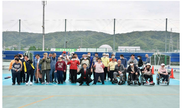
ボッチャ大会の様子

イベントにご参加いただける 方、一緒にスタッフとして盛り 上げていただける方、どち らも大募集中です！