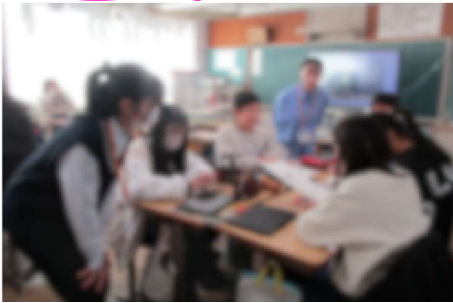
1/7授業づくりと子ども対応交流会

大学生と現職教員等が参加する合同イベントの開催や、教員育成個別サポートを展開しました。また「平和学習プロジェクト」の学生メンバーが、小学校に出張授業を行う事業を実施しました。教員志望学生のモチベーション向上につながりました。