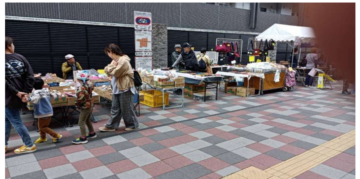
わかいわマルシェの様子

地元商店街や障害者就労支援事業所とタッグを組み、若江岩田駅前マルシェを開催しました。駅前の空間が大きな賑わいを見せ、住民を中心に交流することができました。クリスマスやハロウィンなど季節マルシェを開催し地域に愛されるイベントとなりました。