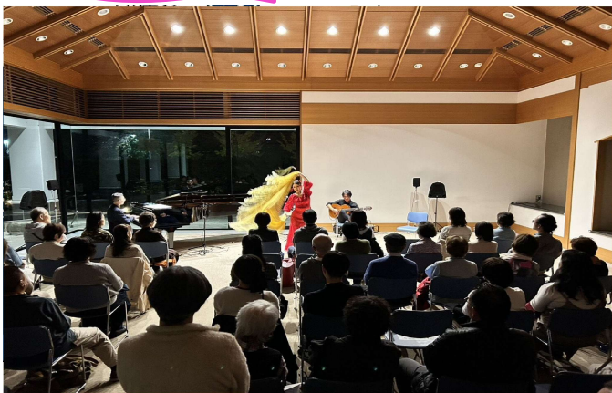
Compás Meets Bop～フラメンコとジャズの融合プロジェクトvol.3の様子

年間5回のイベントを通じ、延べ約200名に生きた芸術を届けました。コンサートやワークショップでは、鑑賞者のリテラシー向上と奏者の育成を両立。市民自らが表現者となる「文化が生まれる街」への確かな一歩となりました。