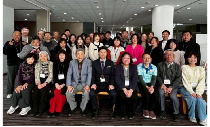
2/1「大交流会VI」参加者全員の集合写真

イベント「分野別交流会(障害・こども食堂)」・「コミュニティコーピング体験会」×4・「大交流会」×2を開催、多くの方が参加くださり、意見交換や情報共有を行うことができました。会員も徐々に増え、協働の取り組みも動き出しています。