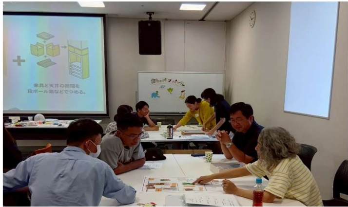
「おしゃべりパーク」防災編

「やさしい日本語×防災」ワークショップや交流の場 「おしゃべりパーク」を通し、ついに「やさしい日本 語版防災ガイド」が完成！今後もこの防災ガイドを 用いたワークショップを開催し、多くの方の手元に 届け、活用していただけるよう活動していきます。