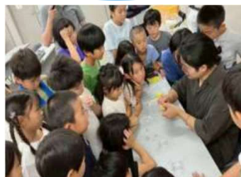
「地域や社会を学ぶ！ワクワク学ぶ夏のよりはうす」の様子（プログラミング体験）