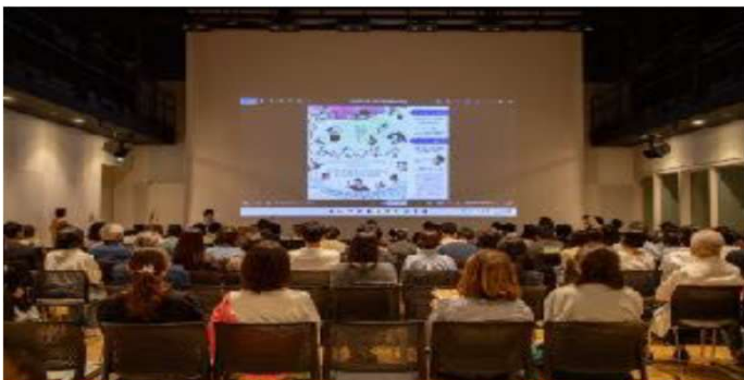
9月開催の上映会・講演会の様子

活動3年目、5回目となる上映会を開催しました。保護者の方、地域の方以外に教職員の方々の割合が増え、対話し繋がりができたことがとても嬉しかったです。現代社会では、家庭と学校と地域との協力が必須で、まさに架け橋になる会だったと感じています。