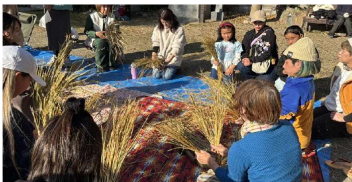
伝統文化継承イベント

映画・伝統・マルシェの3事業で延べ450名超を動員し、多世代が混ざり合う心の居場所を東大阪に創出しました。大人が本気で輝く姿を通じ、子どもたちが未来に希望を持てる場を具現化。この成果を基に助成金から自立し、次年度は他地域へも活動の仕組みを展開します。