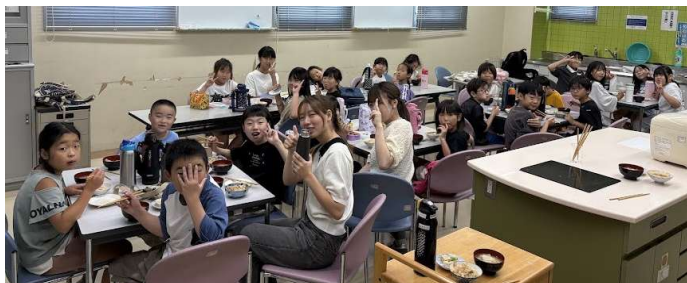
みんなで一緒にいただきます★

イベント・交流会・育児講座を合わせ63回開催し、総数約450名(+自由来場者300名程度)が参加しました。今回の“子どもの居場所づくり”は、中学生の自習を目的とした会も開催しました。更に来年度は、高校生も参加できるように、子ども達が継続して参加できる仕組みを考えています。