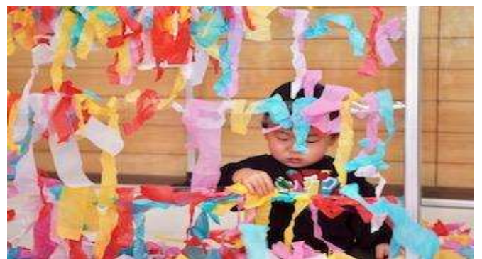
従来の『遊び』と少し違った視点で展開する教育のプロならではのアクティビティに自信があります！

広いサロンを活かした造形・感覚遊びなど独自の知育活動を展開し、リピーターの親子の来所につながった。2年目は専門家との連携も進み、地域の子育てや教育に一定の貢献ができたと考えられる。