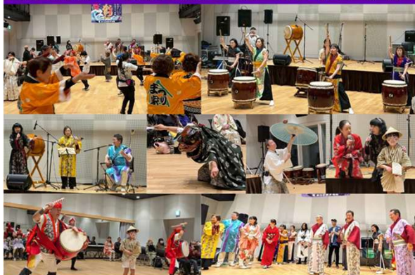
新しい形の盆踊り提案イベント

「盆踊りで踊ってみたい…」「河内音頭に興味があるけど…」という方を対象に『河内音頭セミナー』を開催し、参加者が演奏や踊りを体験。新しい形の盆踊り提案イベントでは、河内音頭以外の郷土芸能とのコラボで世代をこえた来場者が楽しめる空間共有を実現。