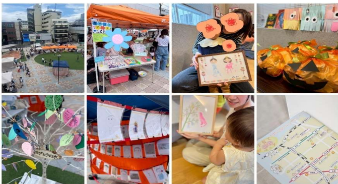
親子の元気から町全体を元気に！