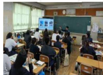
「企業と学校をつなぐ！みんなが先生夢の協育プロジェクト」の様子

夏季休業期間中に19日間、企業等と連携し、日替わりで様々な企業やNPO等の団体が体験活動をはじめとした各種活動プログラムを提供や昼食やおやつを提供する、こどもの居場所づくり事業を実施しました。また、企業等が実施する社会貢献活動(CSR活動)による出前授業を学習プログラム化し、中学校で様々な大人の話や学びのキャリア教育の機会を創出できました。