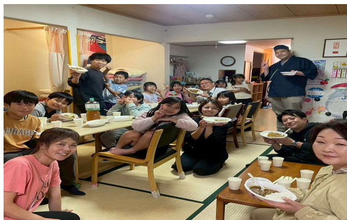
地域の大人と学ぶ時間

まちづくり助成金で、おしごと紹介に使うプロジェクターや講師の招へい、チラシ・保険などをまかさないました。令和7年5月の開設から月2回、調理師がつくる温かいごはんと学習支援で、子どもたちの「できた！」を応援しています。