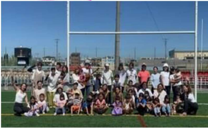
花園ラグビー場内の芝の上でヨガをしました。

今年は2年目となり、より一層充実した内容で開催するべく去年の反省を生かし保育士の確保など見直したところ新規動員もできリピーターの方にも来ていただくことが出来ました。今回で地域事業としての活動は終了いたしますが、引き続き活動して参ります。