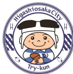
東大阪市マスコットキャラクター 「トライくん」