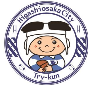
東大阪市マスコットキャラクター 「トライくん」