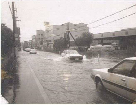
八尾枚方線 (昭和60年)