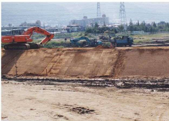
花園多目的遊水地施工状況