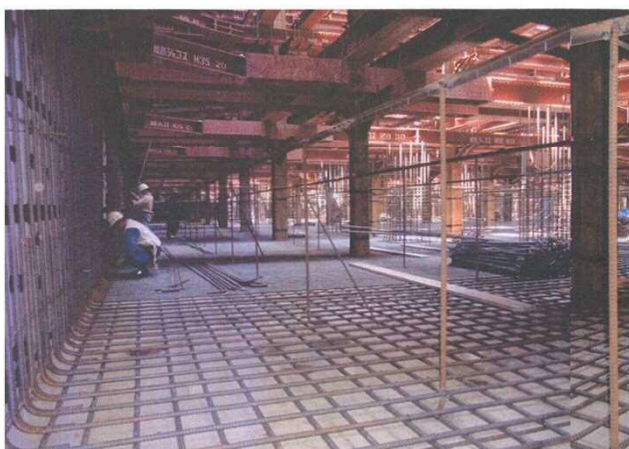
八戸の里公園（小阪）調節池施工状況（地中部）