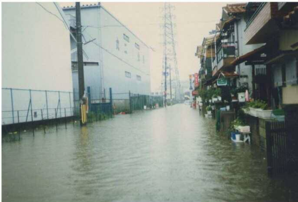
善根寺町 (平成元年)