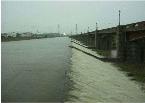
池島 I 期越流状況