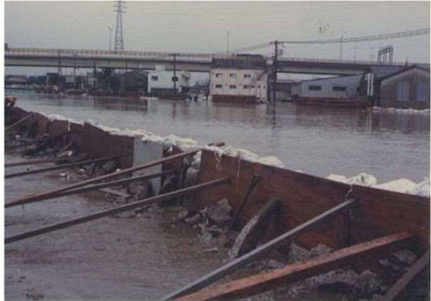
第二寝屋川(昭和57年)