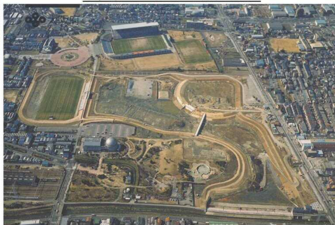
花園多目的遊水地航空写真