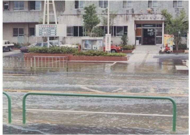
河内警察前 (昭和59年)