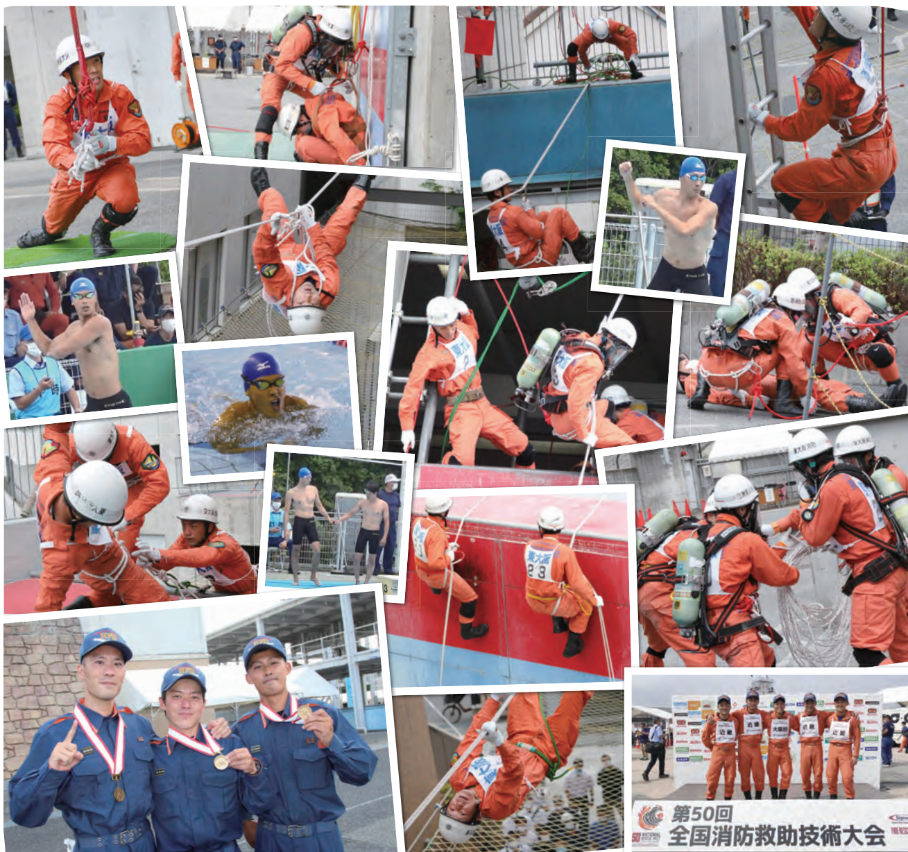
第50回 全国消防救助技術大会

市消防局は、昨年7月23日に兵庫県広域防災センター(兵庫県三木市)で開催された第50回消防救助技術近畿地区指導会に出場し、陸上の部の「はしご登はん」大阪府下1位、「ロープフリス」救出近畿地区1位、水上の部の「基本泳法」近畿地区1位、「溺者搬送」近畿地区2位の成績を収めました。この4種目の近畿地区代表として、同年8月26日に開催された全国消防救助技術大会に出場しました。