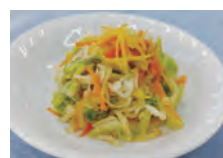
身近な野菜で作れます。すりごまとゆずの皮でもおいしくいただけます。

けて食べる 白菜と切り干し大根のあえ物 (1人分の栄養価: エネルギー 44kcal、塩分0.5g、野菜65g) 材料(2人分) 白菜100g、切り干し大根10g、にんじん20g、ゆずの皮少々、すりごま小さじ1、A(酢小さじ2、砂糖小さじ1・1/2、しょうゆ小さじ1) ①切り干し大根は水で戻し、軽くゆでて、しっかり水気を絞る ②白菜は1cm幅に切り、にんじんは千切りにし、固めにゆでてしっかり水気を絞る。ゆずの皮は細い千切