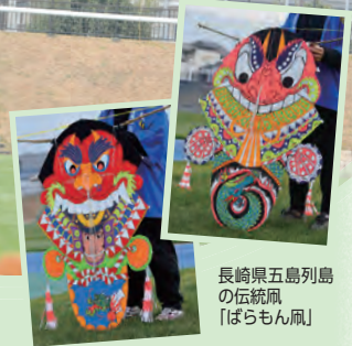
長崎県五島列島の伝統風「ばらもん風」