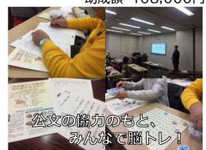
公文の協力のもと、みんなて脳トレ!

コロナ禍でしたが当初の予定通り、中止なく開催できました。参加者が増え、定着し、毎回50人近く参加いただきました。参加費や協賛金によって、活動内容も充実し、体力づくり、脳の活性化など心身の若返りができ、当初からの目的である、健康の維持と地域の交流の場となることを達成し、地域の絆を広げ深めることができました。