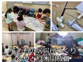
子どもの居場所づくり & やどり木未開放日

今年度は、イベント・交流会・育児講座を合わせ71回も開催することができました(1月末現在で総数約750名)。また、発達相談の場や、夏休みや冬休みに子どもたちが一緒に宿題をしたり、遊んだり子どもの居場所づくりを新たに始めることができました。毎月、交流会を開催することで、定期的に参加して下さる方も増えてきました。今後は、瓢箪山周辺の地域とも、連携をもっと深めていきたいです!