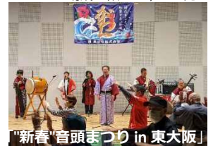
「新春“音頭まつり in 東大阪」

祭りや盆踊り、各種イベント開催に関する意見交換会を2回、河内音頭講習会を4回開催し、地域でのまつりや盆踊り開催に関する問題点等を確認・整理することができました。それを基に子どもから大人まで、三世代・四世代で共有できる様々なジャンル(アニメソング、ポップス、演歌、民謡)を融合した、新しい形の祭りや盆踊り提案として「新春“音頭まつり in 東大阪」を開催!