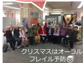
クリスマスはオーラルフレイル予防!