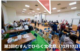
第3回むすんでひろく文化祭(12月17日)