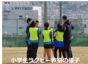
小学生ラグビー教室の様子

幼児や親子ラグビー教室では、初めてラグビーをしたという 方々が、「やってみたら凄く楽しかった。」という感想を頂 き、ラグビーのまちで実際にラグビーを「する」経験を楽し くやっていたことができたかなと思っております。幼児 ～大人と幅広い世代の方々がラグビーを通して「楽しみ・繋 がり」を持つことができる機会になったのではないかと思います！