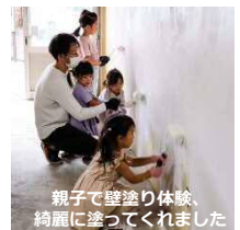
親子で壁塗り体験、 綺麗に塗ってくれました

昨年度の壁塗りワークショップを始め、居場所を一から作る ことで地域住民や子供たちにとって街への関心が広がり、欲 しい場所・まちは自分たちで作れることを共有しました。実 際に改修過程が記憶に残っていたり、イベント時以外も足を 運んでくださる方も居られ、愛着を持ってくださることがで きました。日常的に開くためにこれからも共に改善し、生活 に寄り添った場所を目指していきます。