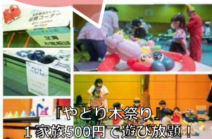
「やどり木祭り」1家様500円で遊び放題!