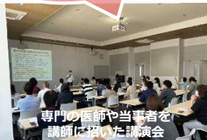
専門の医師や当事者を講師に招いた講演会