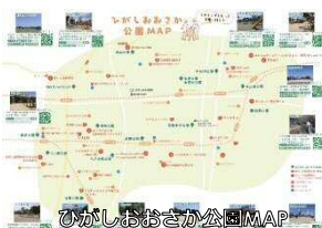
ひがしおおさか公園MAP

第3回菜の花フェス～ままのわを広げよう～を花園中央公園で開催。地元の企業や子育て支援団体にご協力いただき、これまで以上に幅広い世代の方に活動を知っていただく機会となりました。また、今年度は東大阪の公園MAPを作成。トイレ等の基本情報や近隣の子連れでいけるお店も掲載しています。これからも東大阪での子育てがより楽しくなるような活動をしていきたいです。