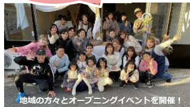
地域の方々とオープニングイベントを開催！