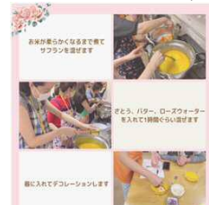
ライスの「サフラン」

7月と2月に多言語・多文化イベント「なぞとき世界旅行+」、9月と3月に多言語・多文化ワークショップを行いました。成人の方はもちろん、学生さんやご家族連れなど多くの方にご参加いただきました。外国人住民との楽しい交流を通し、多くの国のことと文化、料理の作り方など多くのことを学ぶ機会となりました。