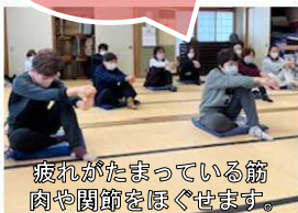
疲れがたまっている筋肉や関節をほぐせます。

地域連携の下、孔舎街公民館(住民活動の拠点)を活用し、男女問わず様々な世代が参加出来る体操や、SNSで「町の魅力を子育て世代に認知してもらおう!プロジェクト(地域活性化プロジェクト)」を企画する。 助成額 70,000円