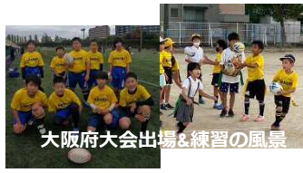
大阪府大会出場＆練習の風景