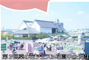
第3回菜の花フェスin花園中央公園