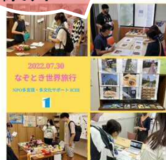
多くの協力者が考えた謎解きゲームに挑戦！