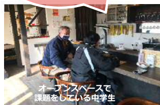
オープンスペースで課題をしている中学生