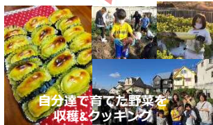
自分達で育てた野菜を収穫＆クッキング