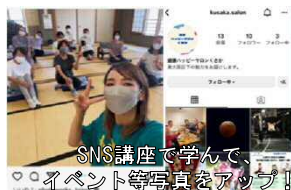
SNS講座で学んで、イベント等写真をアップ!