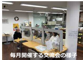
毎月開催する交流会の様子

助成金を活用し、7月と12月、3月に東大阪商工会議所にて開催しています。内容は、若年性認知症や高次脳機能障害の専門医だけでなく、当事者にも登壇して頂き、障害について市民に幅広く理解して頂くことができました。また、地域の施設を使用し、当事者の社会参加の機会として交流会を月2回、年間で20回以上設けることができました。