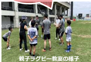
親子ラグビー教室の様子