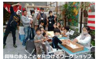
興味のあることを見つけるワークショップ

フリースペースかんの主催の「自分の好きなことを見つけるワークショップ」を4回実施（1回は2/26実施予定）し、28人の不登校や発達障害の児童生徒や保護者が地域のひととともに参加した。また、不登校の相談でフリースペースを訪れたのは11家族、18回、38名でした。今年は「保護者を元気に」を合言葉に、元気なお母ちゃんにも参加してもらって交流会を定期的実施する予定。