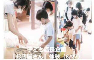
子ども居長企画 『お店屋さん』体験(8/27)

41回の交流会、5回の講座、子育て世代向けのイベント4回(4回目は3月開催)開催することができました。子育て世代からの「また来たい!」「気持ちが楽しくなった」という嬉しいお声をいただくことができ、また、イベントでは企業×学生×市民を一つの場所に集結し、そこから新たなご縁がつながって、様々なところでコラボレーションが生まれました。