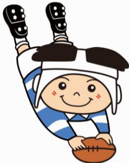
ラグビーのまち東大阪 マスコットキャラクター 「トライくん」