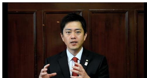
(左：岸田文雄内閣総理大臣、右：吉村洋文大阪府知事)

また、岸田 文雄 内閣総理大臣からは「地方自治体における公民連携のさらなる躍進に期待する」、吉村 洋文 大阪府知事から「地域の実情に応じた社会課題の解決がより一層進むよう願う」とビデオメッセージを頂きました。