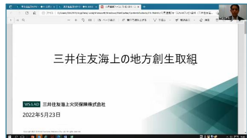
(佐藤氏による講演の様子)