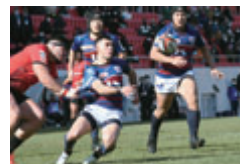
1月22日に開催された試合の様子

ジャパンラグビーリーグワン(花園近鉄ライナーズ対日野レッドドルフィンズ戦)に市民100人を無料で招待します。 日 4月1日(金)19時から 所 市花園ラグビー場第1グラウンド 定 市内在住・在勤・在学(いずれか)の方 定 100人(申込先着順) 席種 ゴール裏B指定席(南スタンド) 日 3月18日