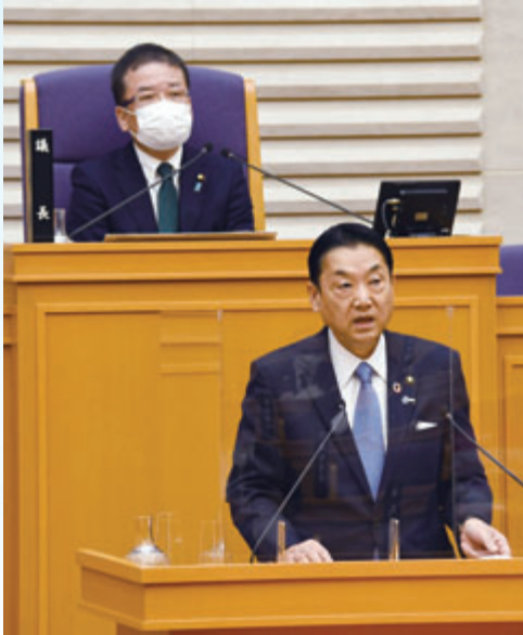
市長 野田 義和

発行：東大阪市長公室広報広聴室広報課 〒577-8521東大阪市荒北一丁目1番1号 ■人口 48万9077人 ■世帯数 23万3124世帯(令和4年2月1日現在) 電話 06(4309)3000 ■FAX 06(4309)3821 ■市ウェブサイト https://www.city.higashiosaka.lg.jp/ ■市公式フェイスブック https://www.facebook.com/higashiosaka.city