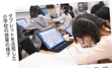
タブレットを活用した小学校の授業の様子