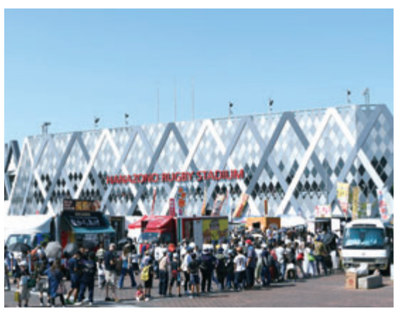
昨年10月に開催された花園ラグビーの口制定記念イベントの様子

で、ラグビー界を盛り上げ、高校ラグビーの支援につながる大会となるよう、鋭意準備を進めてまいります。