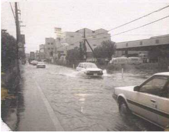
八尾枚方線（昭和60年）