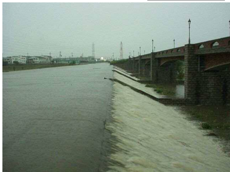
池島 I 期越流状況