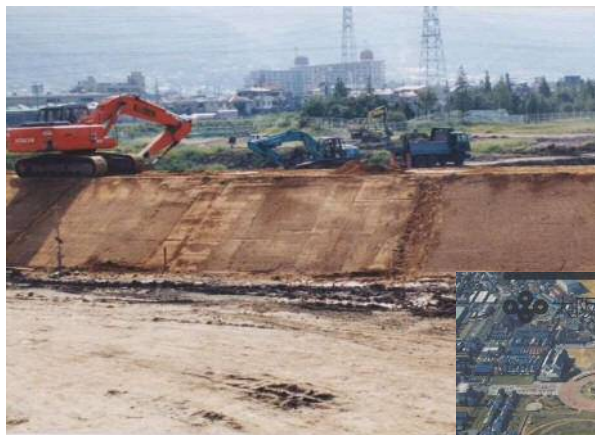
花園多目的遊水地施工状況