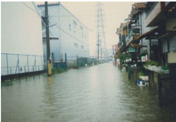
善根寺町（平成元年）