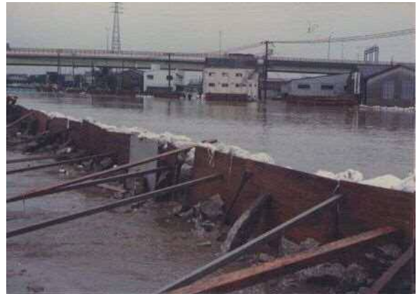
第二寝屋川（昭和57年）