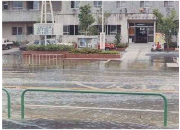
河内警察前 (昭和59年)