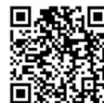
「おいくら」 について