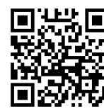
ごみの分け方・ 出し方のページ

発行: 東大阪市 環境部 循環社会推進課 〒577-8521 荒本北一丁目1番1号 電話: 06(4309)3199 FAX: 06(4309)3829