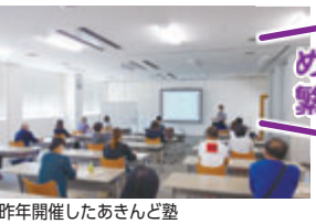
昨年開催したあきんど塾

市では、新型コロナウイルスウィルス感染症の影響でお困りの市内の中小・小規模事業者を対象に、支援策の活用やさまざまな経営相談について専門家に係る相談窓口を開設しています。月曜日には会社などを訪問する出張相談もあります。 時月曜日～金曜日 9時～12時30分・13時30分～17時30分（1社60分程度）※出張相談は月曜日（祝休日を除く）。 【所】市役所本庁舎14階 【甲】基本事項（10面に掲載）と希望日時を希望日の前日16時まで電話または市ウェブサイト申込みフォームで※複数 309）3846 06（4309）3176、FAX06（4309）3846 【甲】産業総務課