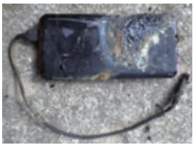
出火したモバイルバッテリー

では、携帯電話、スマートフォン、モバイルバッテリー、パソコン、デジタルカメラ、携帯ゲーム機など、ほんごどの方が手にしたことがあるものばかりです。 充電式電池が異常に膨らむ、いくら充電しても満充電にならないなど、異常がある場合は使用をやめ、販売店などに相談ください。 また、廃棄する際は、機器から取り外して回収施設や回収協力店へ持って行くなど捨て方が決まっています。詳しくは市ウェブサイトのごみの分け方・出し方をご覧ください。