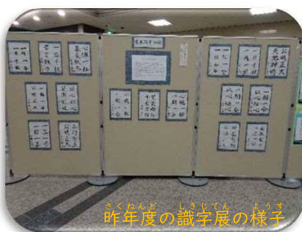
昨年度の識字展の様子