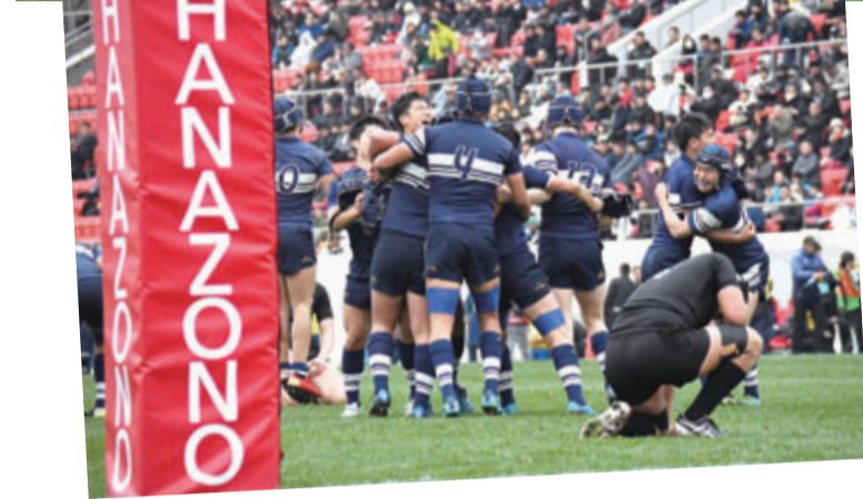
前回の全国高校ラグビー大会決勝戦。白熱した攻防が繰り広げられ、御所実業高校が破り、桐蔭学園高校が優勝しました。