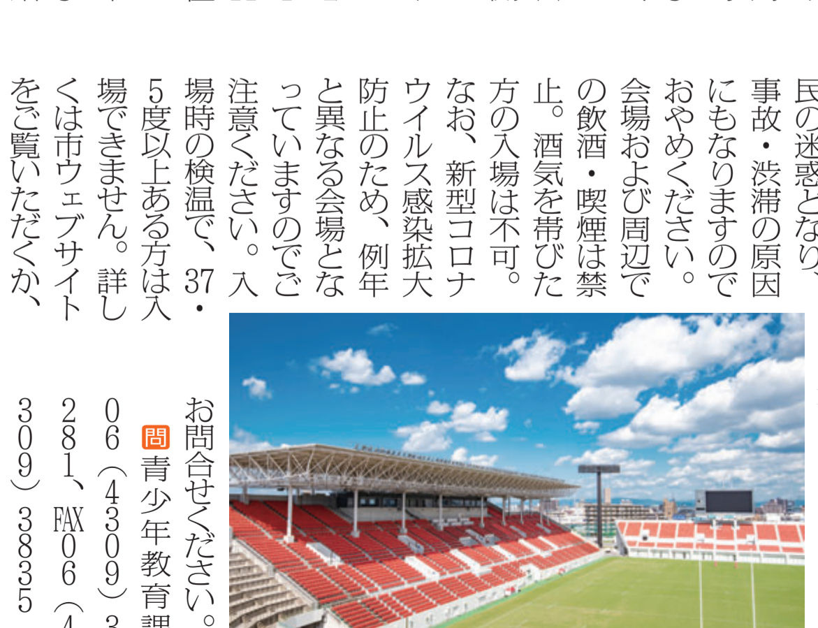
市花園ラグビー場 第1グラウンド

新成人を祝う成人祭を市花園ラグビー場で開催します。対象者には、12月上旬に案内状を送付します。ぜひ、ご参加ください。 時 来年1月11日(祝) 11時~11時30分(開場は10時) 所 市花園ラグビー場 対平成12年4月2日~平成13年4月1日生まれの方(今年11月30日現在、本市に住民登録している方) ※当日は臨時駐車場無料を開放します。会場周辺への路上駐停車は近隣住民の迷惑となり、事故・渋滞の原因にもなりますのでおやめください。会場および周辺での飲酒・喫煙は禁止。酒気を帯びた方の入場は不可。なお、新型コロナウイルスの感染拡大防止のため、例年と異なる会場となっておりますのでご注意ください。入場時の検温で、37.5度以上ある方は入場できません。詳しくは市ウェブサイトをご覧ください。