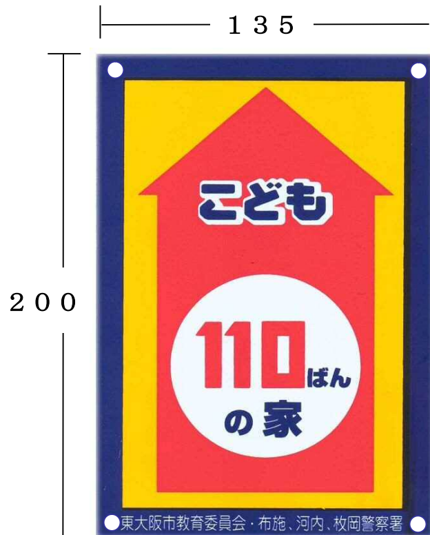
【 プ レ ー ト 】

※ こちらで紹介しているものは教育委員会が無償で配付しているものです。 (この他に、地域で独自のプレート等を作製されているところもあります。)