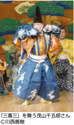
「三番三」を舞う茂山千五郎さん

ダイナミックな空間がひろがる市文化創造館 Dream House 大ホールで、コンサートや伝統芸能を楽しみませんか。8月には、同ホールにある世界最高峰のピアノ「スタインウェイ」の演奏体験も開催します。ぜひ、お越しください。