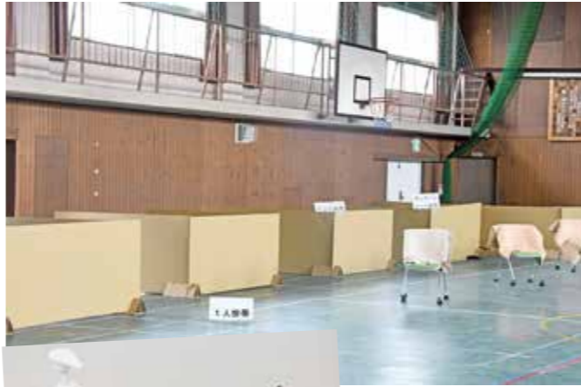
段ボール製ベッドなどは、感染リスク軽減のため十分な距離を置いて配置します(上)。避難所に訪れた市民には検温や手指消毒、「避難者カード」の記入をお願いします(左)。

避難が必要な場合は ためらわずに避難所へ 避難所には、衛生用品の持参、避難の際は従来の災害用備蓄品(水・食料・防寒着・常備薬・貴重品など)に加えて、マスクやアルコール消毒液、体温計、上履き、石けんなど、感染症予防に必要なと思われるものも可能な限り持参してください。 【基本的な感染症対策】 身体的距離の確保、マスク着用や咳エチケットの徹底、こまめな手洗いを心がけてください。