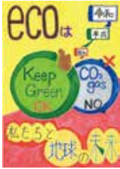
昨年の最優秀市長賞受賞作品

3R(ごみの減量・再使用・リサイクル)の推進、地球環境の保全、環境美化に関するポスター作品を募集します。優れた作品には賞を授与します。市内在学の小・中学生 規格 B版8つ切りで縦横は自由(1人1点のみ) テーマ の例 マイバッグ・マイボトルの活用、食べ残しなどの「食品ロス」の削減、無駄な電気やガスの節約など省エネルギーに対する心がけや実践、ソーラー・風力・地熱発電などの再生エネルギーの活用、ポイ捨てや歩きたばこの禁止 作品 (裏面に応募用紙貼付)を10月16日(金)(必着)までに郵送または直接 ※詳しくは市ウェブサイトをご覧ください。 申込 577-8521市役所循環社会推進課 06(4309)3199、FAX06(4309)3829