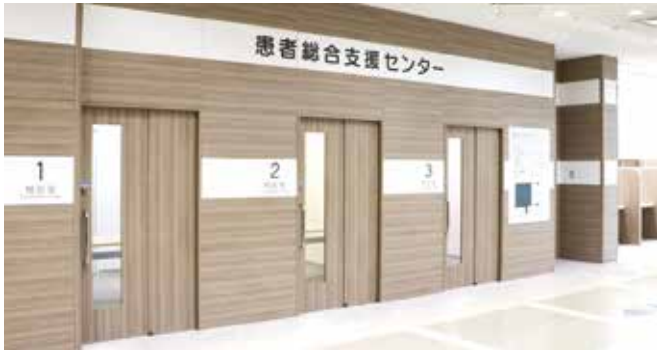
患者総合支援センター

このほど市立東大阪医療センターに、患者総合支援センターを開設しました(写真)。これまで院内各所に散在していた患者対応・相談・手続などの部門を集約し、患者への支援や病院内の職種間連携、病院外の医療職・介護職などの連携を強化します。