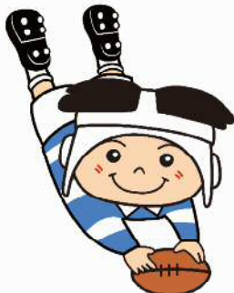
ラグビーのまち東大阪 マスコットキャラクター 「トライくん」

上 級 福祉 初 級 事務・土木・建築 専門職 保育士・幼稚園教員 心理判定員・薬学・管理栄養士