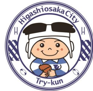
東大阪市マスコットキャラクター 「トライくん」