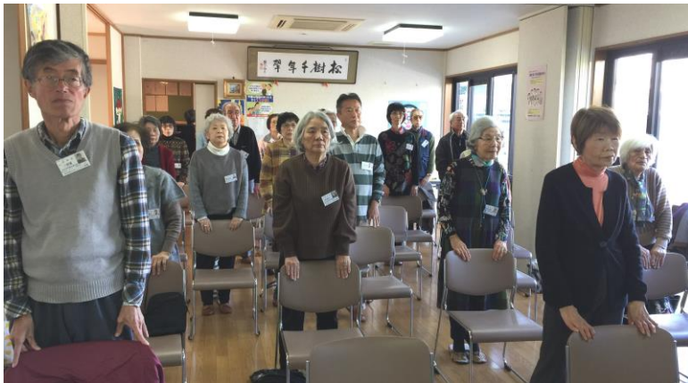
上の写真は、北石切茶論の体操の様子です。

北石切茶論の利用者から「全身運動を通じた誤嚥予防と身体機能の向上を目指した体操教室」を強く要望され、始めることになった通所型つどいサービスです。