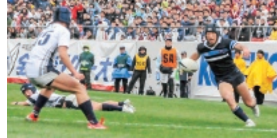
昨年の全国高校ラグビー大会の開会式(上)と決勝戦(右)

市花園ラグビー場で、12月27日から全国高校ラグビー大会が開催されます。新しくなった聖地「花園」で行われる初めての大会です。ぜひ家族や友達といっしょにご観戦ください。