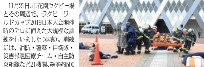
HANAZONO RUGBY STADIUM

11月21日、市花園ラグビー場とその周辺で、ラグビーワールドカップ2019日本大会開催時のテロに備えた大規模な訓練を行いました(写真)。訓練には、消防・警察・自衛隊・災害派遣医療チーム・自主防災組織など21機関、総勢約500人が参加しました。訓練は、ラグビー場内での化学物質を使ったテロとラグビー場前の噴水付近での大規模な爆弾テロを想定。ラグビー場内では、多数の負傷者が横たわる中、決死の救助活動が行われました。また爆弾テロの現場では負傷者の救助活動の中、さらにバトントワーリングの良さを活かして新しい最悪の事態を想定して進められました。今回の訓練には、さまざまな機関が参加し、さらに共同で活動することで各機関の能力や対応方法などを共有することができ、非常時の連携の大切さを再確認しました。市では、このような訓練を重ね、非常時のほか、大規模な災害にも備えます。