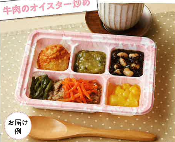
牛肉のオイスター炒め