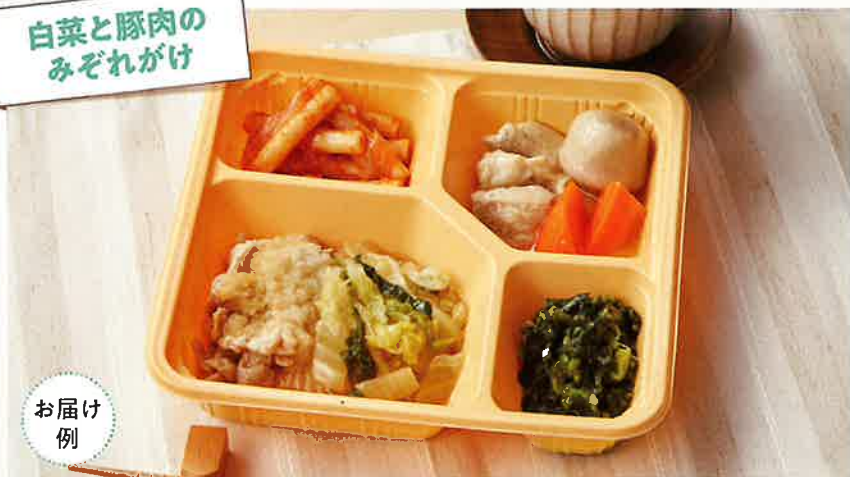
白菜と豚肉のみぞれがけ