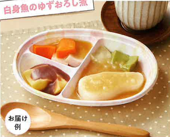
白身魚のゆずおろし煮